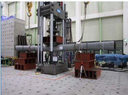
PHC 파일 성능시험