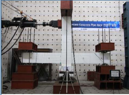
PS 보-기둥 성능시험