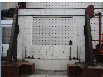
벽체 보-기둥 반복이력 실험