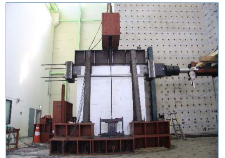
벽체 전단 성능시험