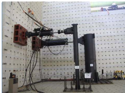
강관파일 내진 성능시험