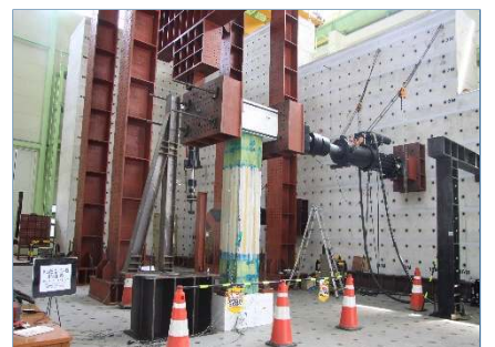
보강 기둥 내진 성능시험