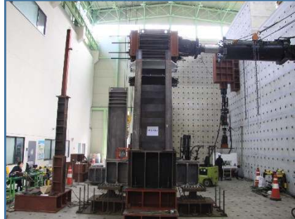
강재 접합부 성능시험