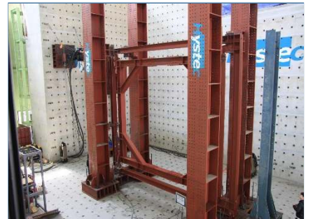
건축물 댐퍼 적용 성능시험