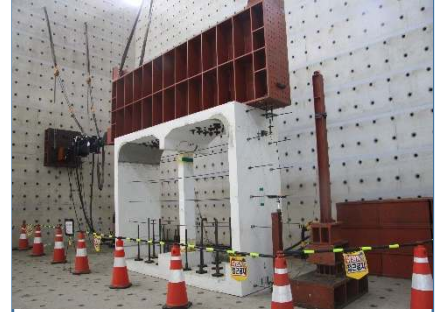
지중 RC 구조물 재하시험