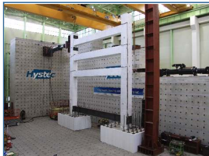
멀티 프레임구조 성능시험